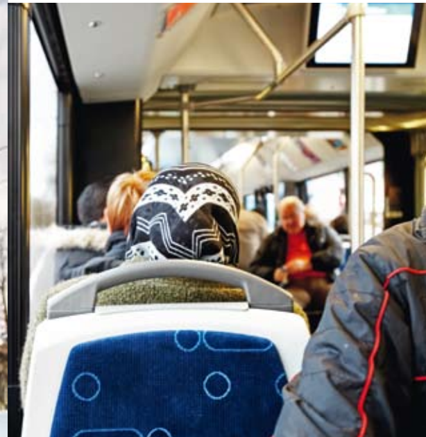
Bus für jedermann: Der 31er befördert 38500 Menschen pro Tag.