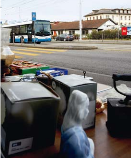
Krimskrams und mehr: Eines der originellsten Brockenhäuser der Stadt findet man direkt an der Station «Güterbahnhof».